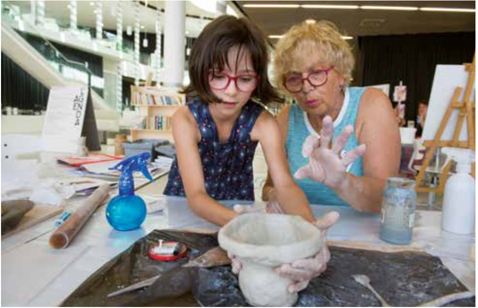
Journée « Sortez les pincesaux - branchez les pianos », photo : Franck Alix