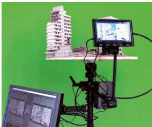
Vue d'exposition, WWT, Galerie 22,48 m³, Paris, 2019