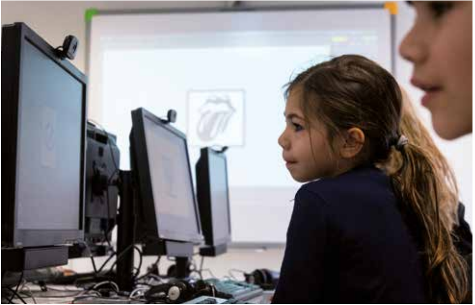
Séances d'ateliers à l'atelier multimedia et lors du Labo, photos : Ville de Colomiers