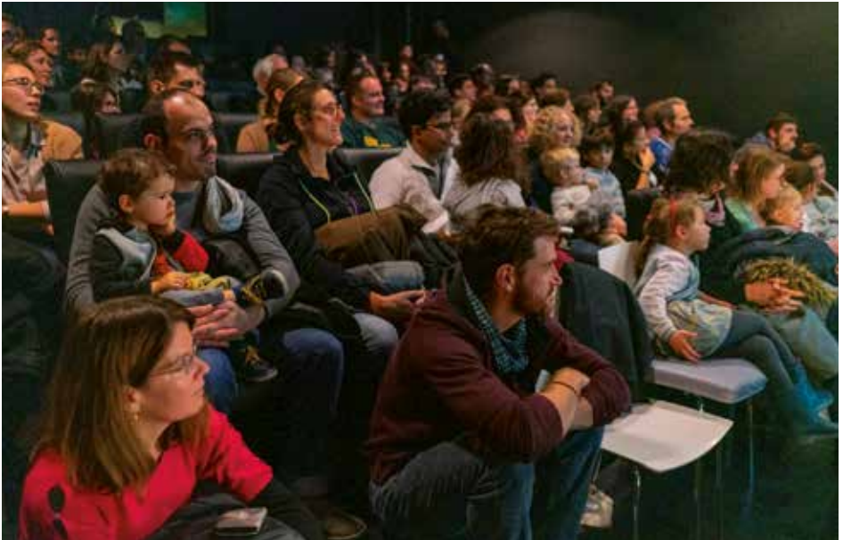
Salle de conférence du Pavillon blanc Henri-Molina, photo : Ville de Colomiers